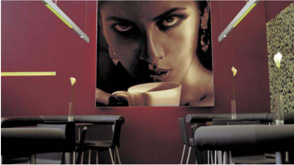
UTAH PROFIL: Licht und Farben prägen die Erlebnisgastronomie. Sie vermitteln Gefühle und wecken Neugierde.