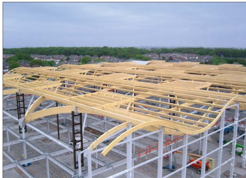
Der neue Marks & Spencer Flagship Store setzt auf Holz – allerdings nur im Dach.