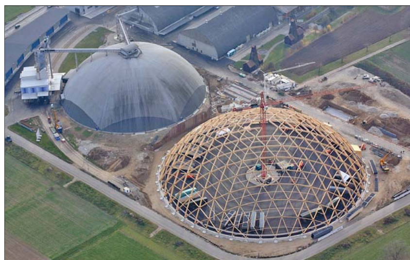
„Saldome 2“ – Das Tragwerkskonzept der zweiten Kuppel entspricht dem der ersten: drei sich durchdringende BSH-Bogensysteme bilden das Tragwerk. In jedem Knoten treffen sechs Bogenteile aufeinander.