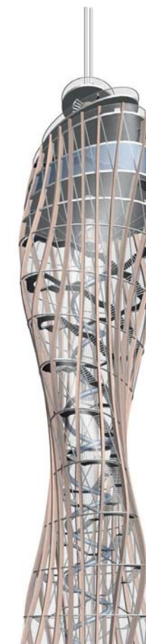
Entwurf des für den Pyramidenkogel in Kutschach (Kärnten) geplanten Aussichtsturmes