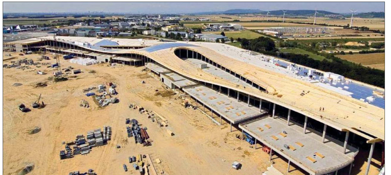
Das etwa 550 m lange Holzdach des „G3 Shopping Resort“ in Gerasdorf überspannt das über acht Fußballfelder große Einkaufsdorado wie eine Welle.

er fast immer Holz eingesetzt hat. Ohne auf Holz fixiert zu sein, nutzte er den natürlichen Baustoff gemäß seine Möglichkeiten, z. B. um wirtschaftlich und