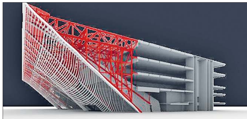
Der Entwurf eines neuen Konzert- und Theaterhauses in Kristiansand (Norwegen) Grafik: Marit Kvaale/Trebyggeriet AS

Ein weiteres spektakuläres Objekt, das Teil des neuen Konzert- und Theaterhauses in Kristiansand im Süden von Norwegen ist, stellte Dipl.-Ing. Franz Tschümperlin von der SJB Kempter Fitze aus Eschenbach (Schweiz) vor: Die Wellenfront der Stirnseite des Gebäudes, die den Eingangsbereich markiert. Ihr liegt die Idee zugrunde, dass sich die Fassade von der 22 m hohen Traufkante herab wie ein im Wind wehender Vorhang nach hinten schwingt. Sie besteht