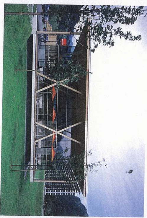
MPreis Bramberg von Heinz-Mathoi-Strelli.